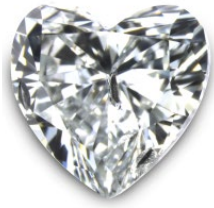
weiße HPHT, G- J, VS1